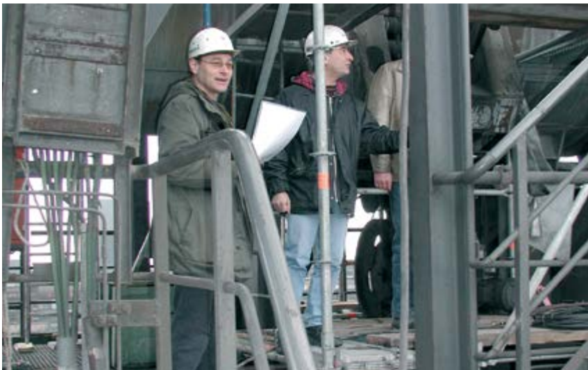
Bild 2-2: Einweisung des Verantwortlichen der Fremdfirma durch den Auftragsverantwortlichen

Die Einweisung sollte in einem Protokoll dokumentiert werden (Beispiel Anhang 3). Im Einweisungsprotokoll wird ausdrücklich auf die Pflicht des Verantwortlichen der Fremdfirma hingewiesen, dass dieser die zum Einsatz kommenden Mitarbeiter der Fremdfirma nachfolgend zu unterweisen hat.