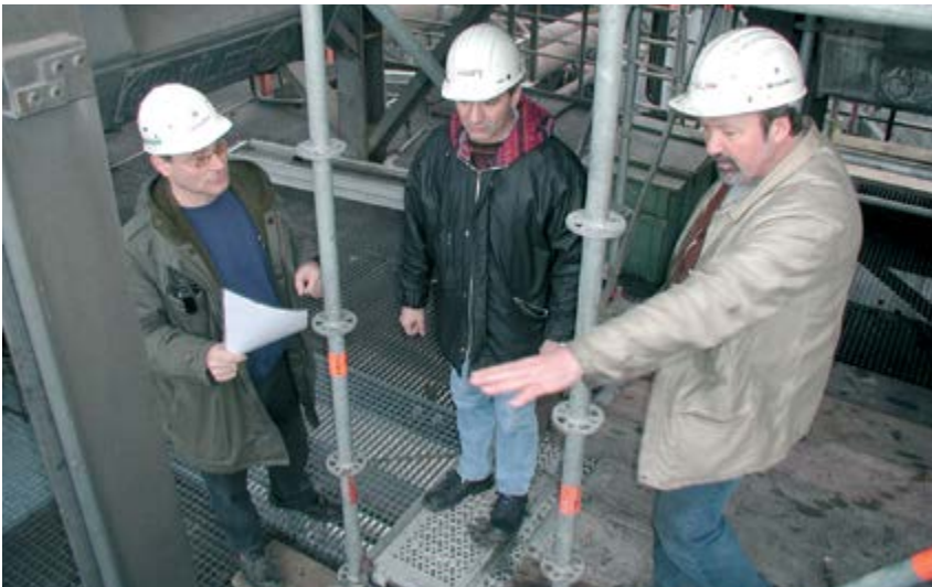
Bild 2-4: Gemeinsame Ermittlung von Gefährdungen (Auftragsverantwortlicher, Verantwortlicher der Fremdfirma, zuständiger Meister)

Abgestimmte Sicherheitsmaßnahmen sollten schriftlich fixiert werden und bei der Auftragsausführung vor Ort vorliegen.